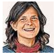
Von Renate Allwicher

Kinder sind lustig und die deutsche Grammatik schwierig. Jeden Tag kämpfen die Ersten mit dem Letzten. Grübeln hochkonzentriert darüber, was groß- und