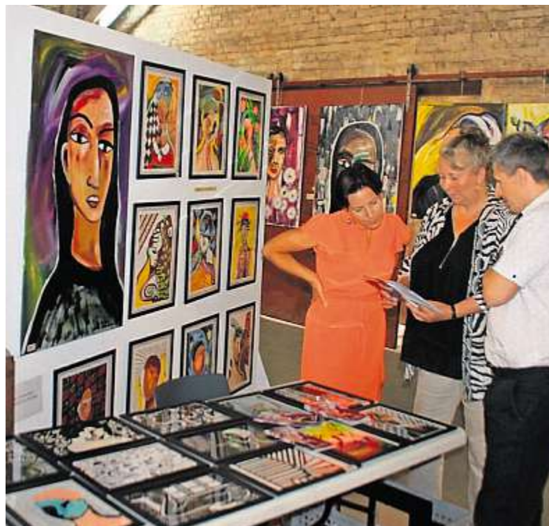
Von 15 bis 12000 Euro reichte die Preisspanne für die Werke, die am vergangenen Wochenende bei der Kunstverkaufsmesse Umschlagplatz in den Alten Pakethallen am Coburger Güterbahnhof angeboten wurden.

Erst kürzlich war der New Yorker Künstler Billy the Artist in Coburg in den Pakethallen zu Gast, um in einer Live-Performance ein Gemälde an die Wand zu sprühen. Das ganze Wochenende über konnten die Besucher die Objekte von Billy the Artist bewundern, die von Goebel in vier großen Vitrinen gezeigt wurden. Zwei Exponate davon gingen an die beiden Gewinner.